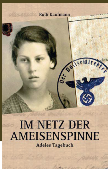
Ruth Kaufmann Im Netz der Ameisenspinne Adeles Tagebuch Roman, 14 x 21,6 cm, 308 Seiten

Adele Kurzweil wurde am 31.01.1925 in Graz geboren. 1938 flüchtete sie mit ihren Eltern vor dem Nazi-Regime nach Paris. Nach dem Einmarsch der Deutschen in Frankreich folgte die Flucht in den unbesetzten Süden.