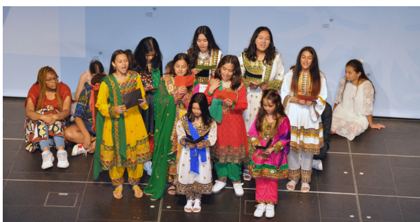
Die Persisch-Dari-Frasi-Gruppe bei ihrer Darbietung eines Volksliedes im Rahmen der Jubiläums-Veranstaltung „50 Jahre muttersprachlicher Unterricht“.

Bei der Veranstaltung im Landhaus haben Schülerinnen und Schüler sowie Eltern und Lehrpersonen aus 15 Sprachgruppen ihre Muttersprache präsentiert. Unter dem Motto „Zwei Sprachen meines Herzens“ haben sie in Form von Liedern, Sketches und Präsentationen bewiesen, dass sie nicht nur eine Muttersprache, sondern mehrere „Herzessprachen“ haben. Beispielsweise haben Schülerinnen und Schüler zweisprachig erklärt, welche Rolle Spanisch und Deutsch in ihrem Alltag spielen, die Regionen Italiens in Gedichtform vorgetragen oder sich in Form eines chinesischen Liedes damit beschäftigt, wie eine glückliche Welt in Zukunft aussehen kann.