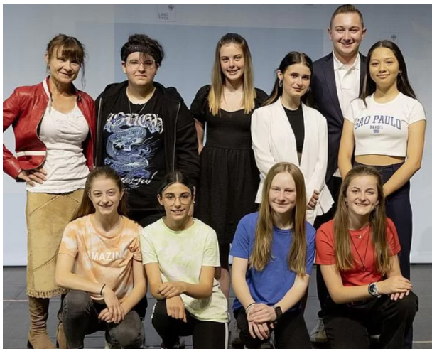
Das Tiroler Team beim Bundesfinale des 70. Jugendredewettbewerbes